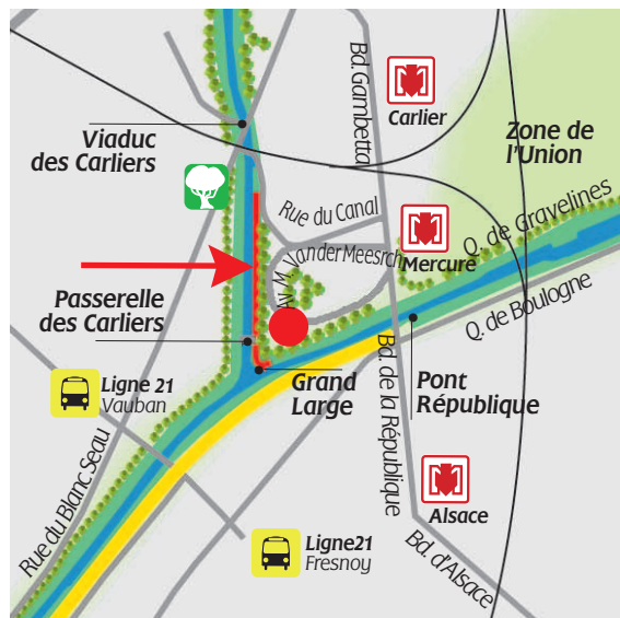
Accès à «l'abord'arbre» Samedi 8 septembre à 15h30